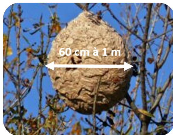
Exemple de nid secondaire en haut d'un arbre