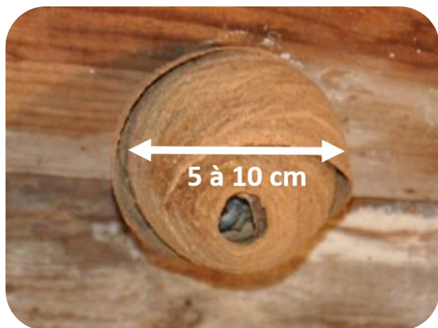
Exemple de nid primaire dans un abri de jardin